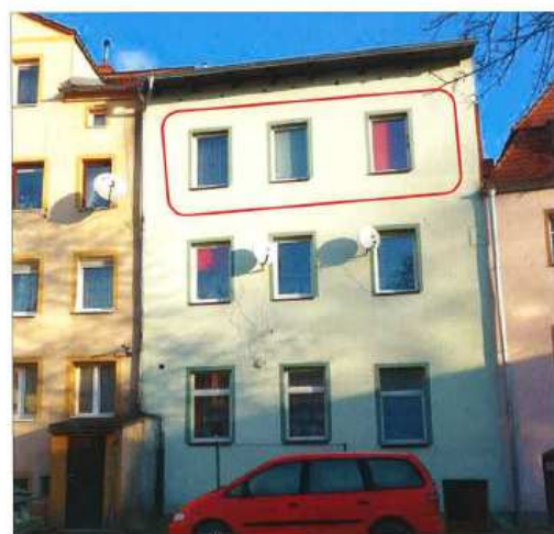
Widok z przeciwnej strony.

Pierwszy przetarg ustny nieograniczony na sprzedaż przedmiotowej nieruchomości został przeprowadzony w dniu 16 października 2018 roku zgodnie z ogłoszeniem z dnia 05 września 2018 roku i zakończył się wynikiem negatywnym z uwagi na brak osób zainteresowanych