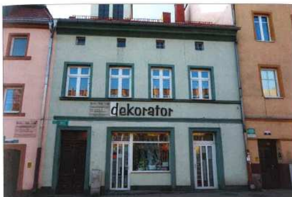
Widok elewacji frontowej - ul. Tkackiej.

na sprzedaż nieruchomości będącej lokalem mieszkalnym Nr 5 znajdującym się w budynku położonym w Lubaniu przy ulicy Tkackiej 10 wraz z oddaniem we współużytkowanie wieczyste ułamkowej części gruntu oznaczonego geodezyjnie jako działka nr 26, AM 6, Obręb III (księga wieczysta JG1L/00022985/8, powierzchnia 200,00 m 2 ).